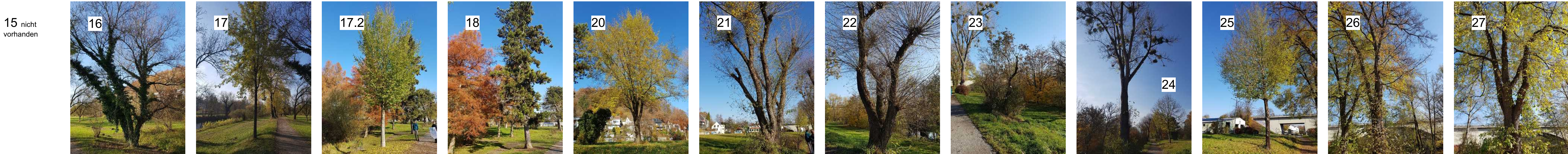
15 nicht vorhanden 16 Weide Biotop zu fällen 17 Ulme Biotop zu verpflanzen 17.2 Ulme Biotop zu verpflanzen 18 Kiefer aufrechter Habitus, leichte Schäden. Zu schützen 20 Ulme oberes Niveau Festwiese zu schützen 21 Weide Habitatbaum zu schützen 22 Weide zu fällen, Für Flussbau seitlich lagern? Nistkasten im Baum! 23 Gebüsch zu roden 24 Esche, zu fällen 25 Ulme, zu verpflanzen 26 Ulme, zu schützen 27 Ulme, zu schützen